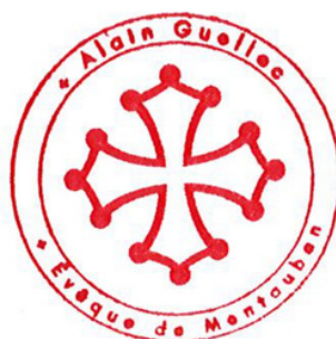
+ Alain Guellec